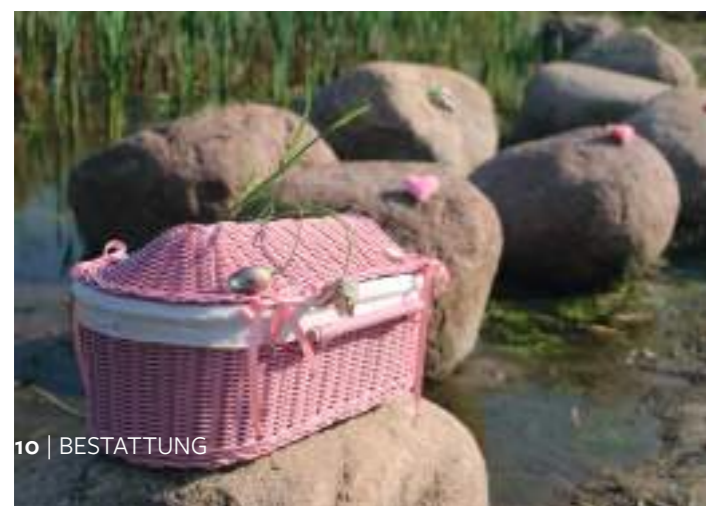
10 | BESTATTUNG

Das verstorbene Kind bleibt immer ein Teil des Lebens seiner Eltern. Es machte sie zu Eltern, die Großeltern zu Opa und Oma, den Bruder oder die Schwester zu Geschwistern. Ich habe einmal die werdende Großmutter eines Babys kennengelernt, das im Mutterleib verstorben war. Ihre Tochter wollte nichts mit dem Baby zu tun haben. Die Oma war verzweifelt, als sie zu uns kam. Als wir